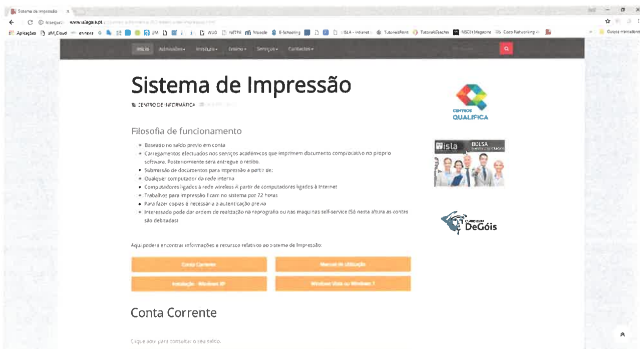
Figura 6: Página dos guias do sistema de impressão

http://www.islagaia.pt/pt/centro-informatica/202-sistema-de-impressao.html