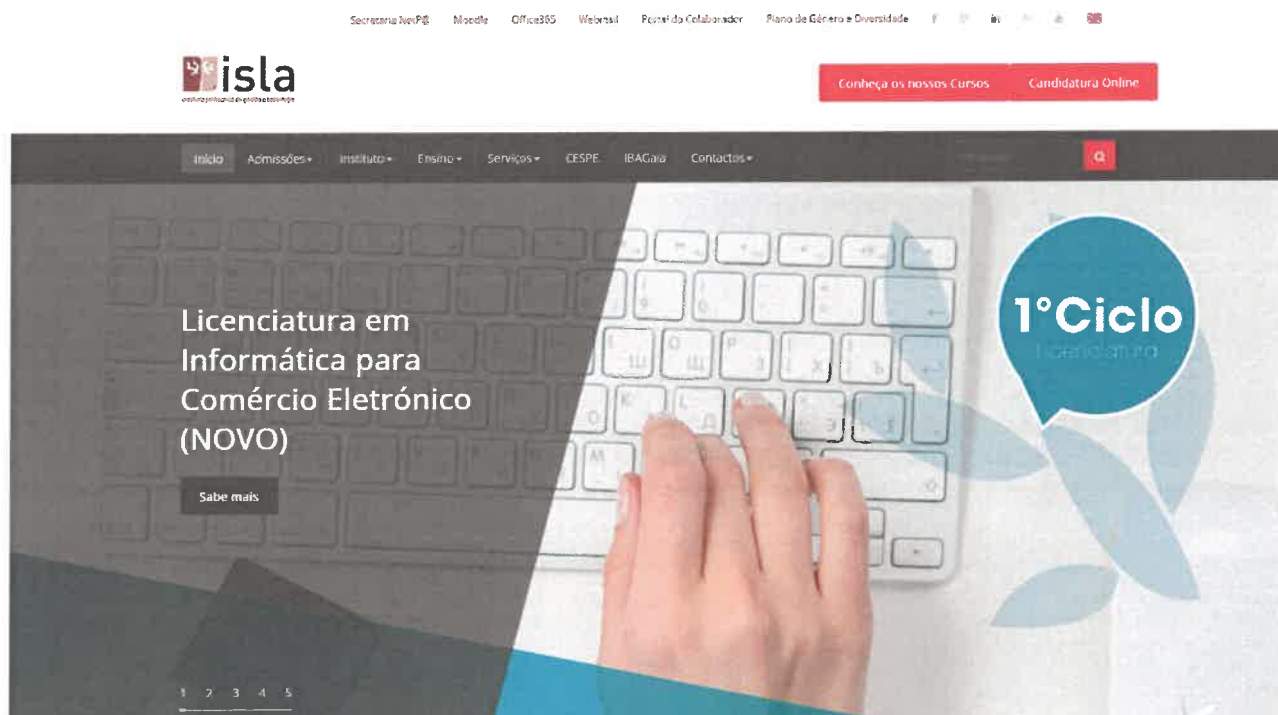
Figura 3: Portal ISLA Gaia

O ISLA Gaia tem presença na Internet através do seu portal em http://www.islagaia.pt onde concentra toda a informação relevante para a sua atividade.