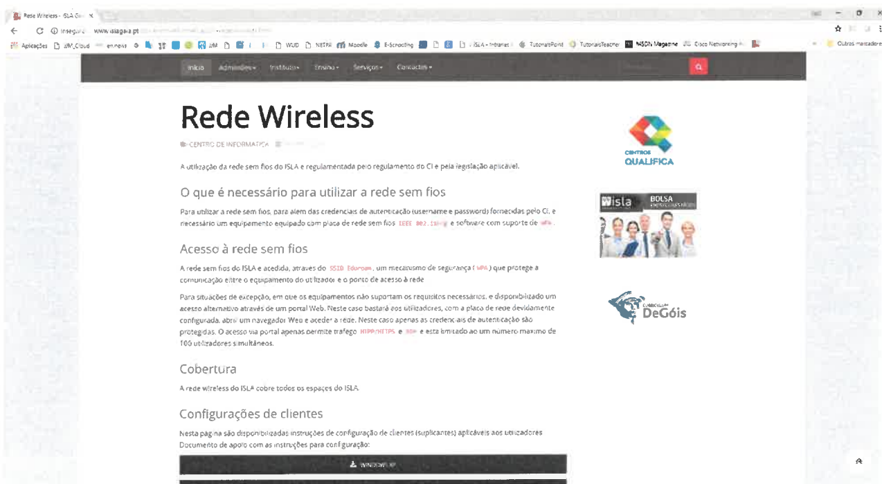
Figura 5: Página dos guias wireless

http://www.islagaia.pt/pt/centro-informatica/201-rede-wireless.html